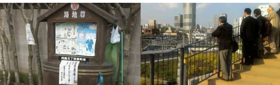
▲すみだ 雨水施設の見学／第5回 エコツアー (2014年4月) 災害時の水源活用が可能な路地尊【左】、雨水活用の押上駅前自転車駐車場【右】