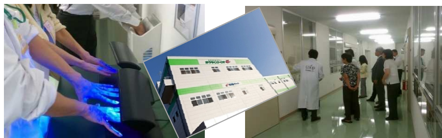
▲ユーコープ様 見学会／第2回 エコツアー (2012年10月) 商品検査センター、森の里要冷セットセンター／神奈川県厚木市

一般市民、次世代を担う学生及び組織(企業を含む)を対象とし、グローバル経済・社会・環