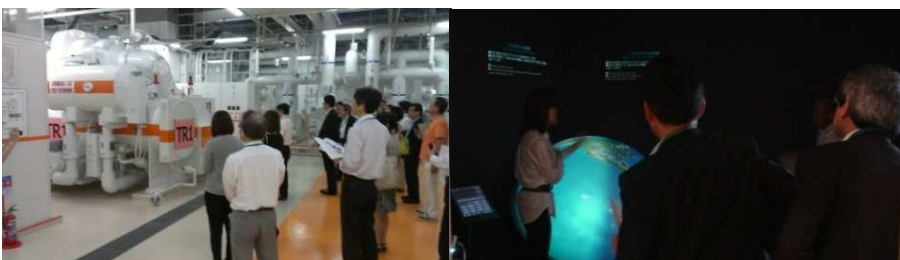
▲千代田区内企業の環境への取り組み / 第3回 エコツアー (2013年6月) 丸の内熱供給(株)による地域冷暖房【左】、エコツツエリア次世代オフィスラボ【右】