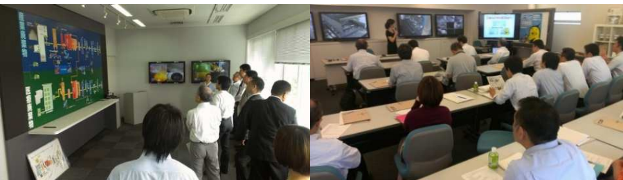
▲東京スーパーエコタウン見学会／第4回 エコツアー (2013年10月) 東京臨海リサイクルパワー株式会社【左】、株式会社リーテム 東京工場【右】