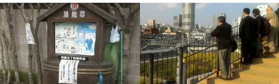
▲すみだ 雨水施設の見学／第5回 エコツアー (2014年4月) 災害時の水源活用が可能な路地尊【左】、雨水活用の押上駅前自転車駐車場【右】