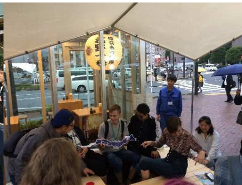
開場1300年の湯の山温泉直送の足湯