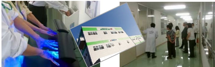
▲ユーコープ様 見学会(2012年10月)商品検査センター、森の里重要冷セットセンター／神奈川県厚木市

2012年より、年1~2回開催し、過去7回に亘って企画・実施してきました。延べ115名の方が参加されています(2017.8 現在)