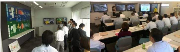
▲東京スーパーエコタウン見学会(2013年10月)東京臨海リサイクルパワー株式会社【左】、株式会社リーテム東京工場【右】