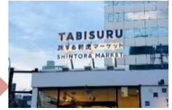
TABISURU SHINTORA MARKET