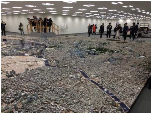
巨大なジオラマに大興奮のオープニング