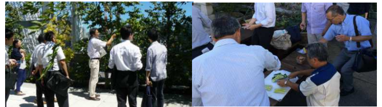
▲銀座 各企業の屋上緑化施設を見学(2015年7月) 資生堂銀座ビルの屋上庭園「資生の庭」【左】、「白鶴銀座天空農園」【右】