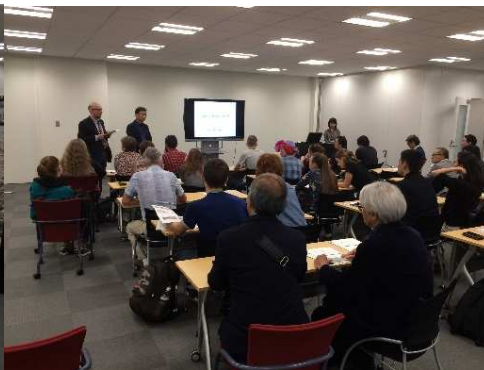
森ビル株式会社様の環境活動を学ぶ