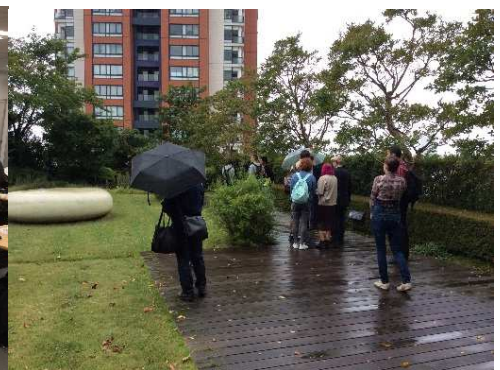
貴重な体験。六本木ヒルズの屋上見学