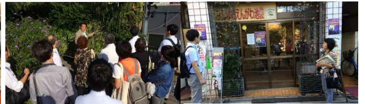
▲豊島区役所「豊島の森」、西武本店、まちなか緑化を見学(2016年10月)西武空中庭園【左】、池袋付近「まちなか緑化」【右】