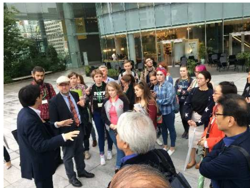
国際新都心へ発展する虎ノ門ヒルズで