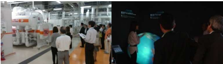
▲千代田区内企業の環境への取組み(2013年6月)丸の内熱供給(株)による地域冷暖房【左】、エコツェリア次世代オフィスラボ【右】