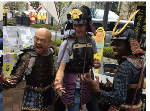
鹿児島・日置市の甲冑体験はコスプレ感覚

NPOサステナビリティ創造研究学会では、一昨年7月、屋上緑化をテーマとした「銀座エコツアー」、昨年10月には「池袋ガーデニングツアー／～人とのつながり、2020年への環境づくり～」を開催してきました。そして今回は第三弾として「環境・景観・環境」をテーマとした、みなと街ツアーを実施。ロシア、アフリカ、中国の留学生、学生※を含む37名の方々にご参加頂きました（※ロシア/太平洋国立大、ハバロフスク国立文化大、武蔵野大、上智大、東京農工大）。雨天ではありましたが、六本木ヒルズ前に13:00に集合。43階フロア一面に設置されたジオラマに圧倒され、参加者のテンションは早くもMAX状態となりました。六本木ヒルズからの「景観」が精巧な模型になっており、参加者はしばし時間が経つのも忘れ、魅入っておりました。次いで、今回、ご協力いただきました森ビル株式会社様の「環境」への取組みについてプレゼンテーション。職・住・遊が接近した都市づくりや自然との共生、低炭素化、資源循環型都市の実現に向けた取組み等の説明があり、外国人留学生にも理解が深まりました。終了後、屋上庭園を視察。雨も小降り↘