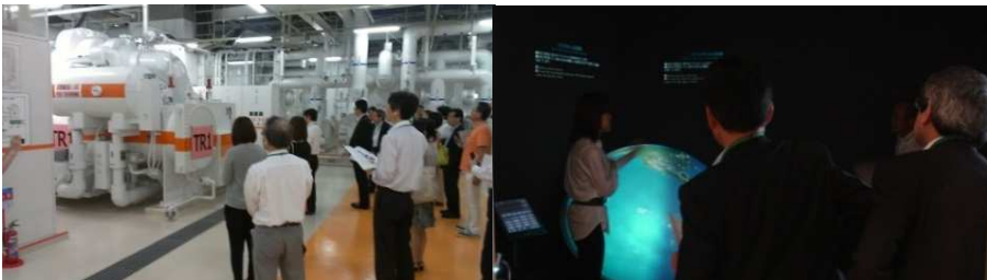
▲千代田区内企業の環境への取組み / 第3回 エコツアー (2013年6月) 丸の内熱供給(株)による地域冷暖房【左】、エコツツエリア次世代オフィスラボ【右】