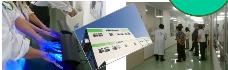
▲ユーコープ様 見学会／第2回 エコツアー (2012年10月) 商品検査センター、森の里要冷蔵センター／神奈川県厚木市

特定非営利活動法人サステナビリティ創造研究学会は、この様な問題を解消するために、学術的および実践的な研究を重ねた結果、一つの打開策として環境マネジメントシステムの自己宣言によるEMSの最適化を提案いたします。