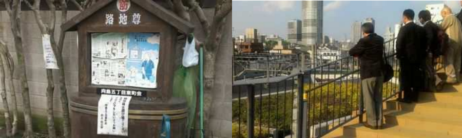
▲すみだ 雨水施設の見学／第5回 エコツアー (2014年4月) 災害時の水源活用が可能な路地尊【左】、雨水活用の押上駅前自転車駐車場【右】