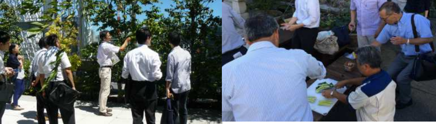
▲銀座エコツアー／第6回エコツアー (2015年7月) 資生堂銀座ビルの屋上庭園「資生の庭」【左】、「白鶴銀座天空農園」【右】