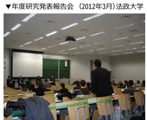
▼年度研究発表報告会 (2012年3月) 法政大学