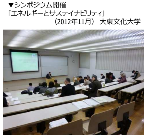
▼シンポジウム開催 「エネルギーとサステナビリティ」 (2012年11月) 大東文化大学