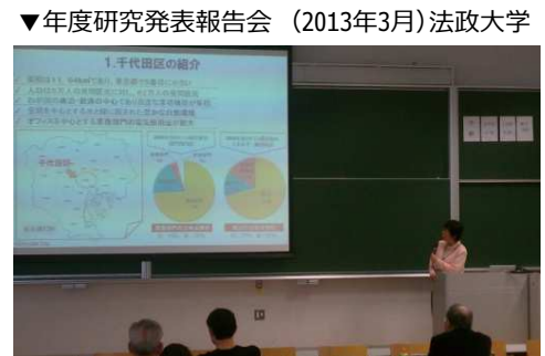
▼年度研究発表報告会 (2013年3月) 法政大学