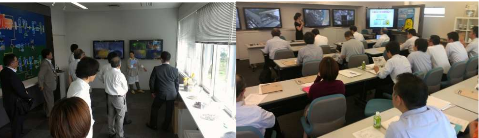
▲東京スーパーエコタウン見学会 / 第3回 サスコミ部会 (2013年10月)