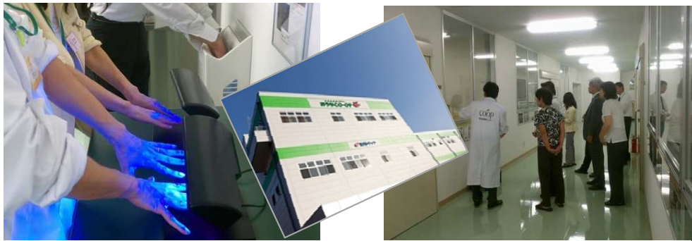
▲ユーコープ様 見学会 / 第2回 サスコミ部会 (2012年10月)