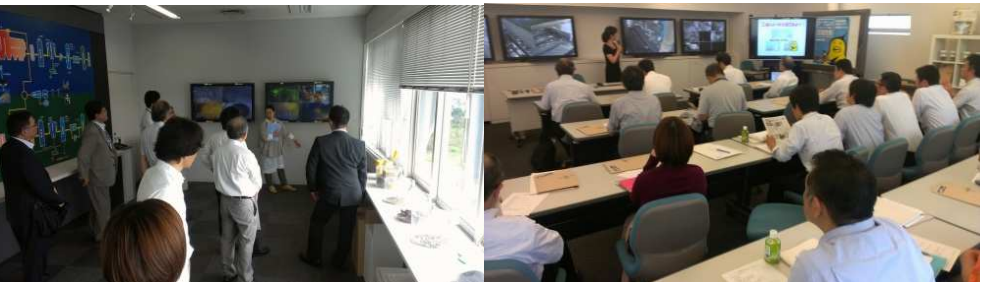
▲東京スーパーエコタウン見学会 / 第3回 サスコミ部会 (2013年10月)