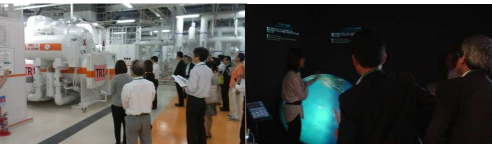
▲千代田エコツアー / 第3回 サスコミ部会 (2013年6月)